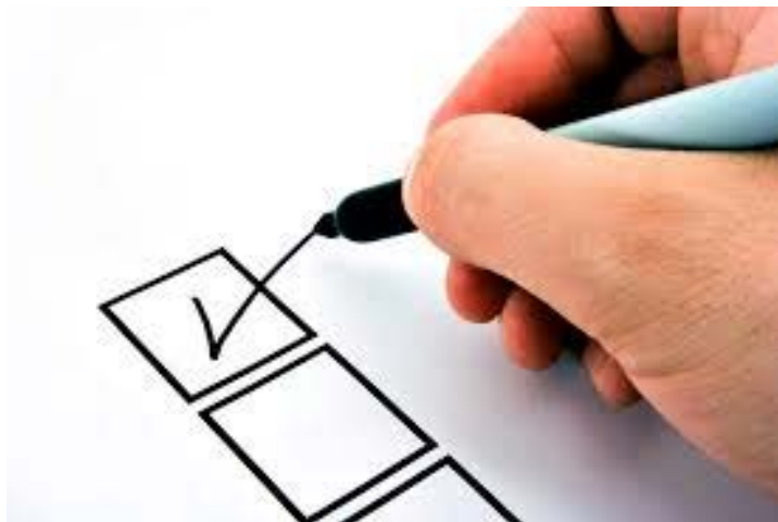
Spørreundersøkelser om livskvalitet