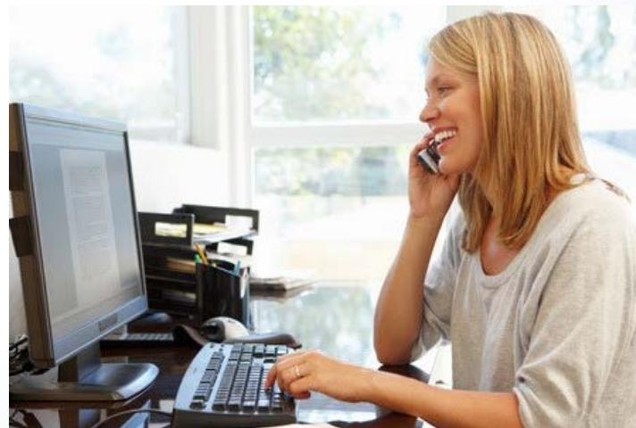
Telefonintervju for gradering av inkontinens