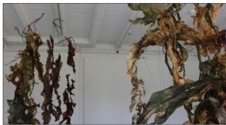
DØDT: Tran har samlet inn, vasket, tørket og hengt opp dødt sjøgress som har skylt i land i Tromsø.