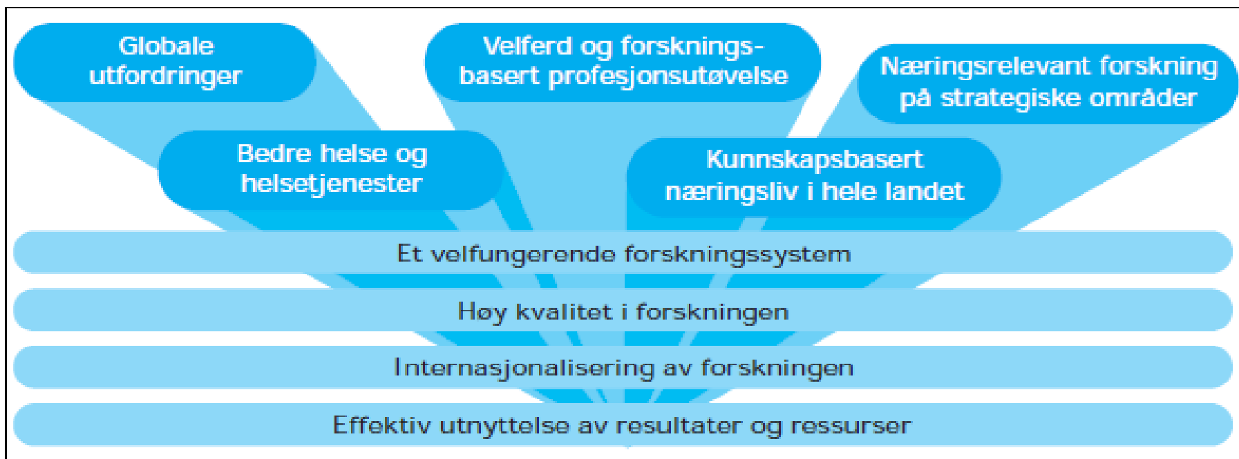
Figur 2.3 Mål for norsk forskning